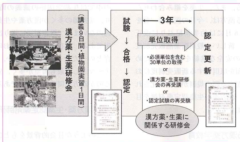
図2 漢方薬・生薬認定薬剤師の認定と認定更新

なっており、1回70分での全45講義を9日間で受講するとともに、春期もしくは秋期には全国各地の薬系大学等の薬用植物園約40か所の協力を得て、植物園での実習も実施している(図2)。講義は東京で開催される座学講義の他に、座学講義の収録ビデオをビデオ講義として各地で受講することができる。研修講義を受講した後は、認定試験が課されており、試験に合格した者だけが3年間の有効期限付きの漢方薬・生薬認定薬剤師証が交付される。本学問領域の最近の急速な進歩と医薬行政の変化に対応するためには、専門知識の維持更新が必要であることから、この認定制度には更新制度が設けられている。更新のためには、毎年開催される関連学会や